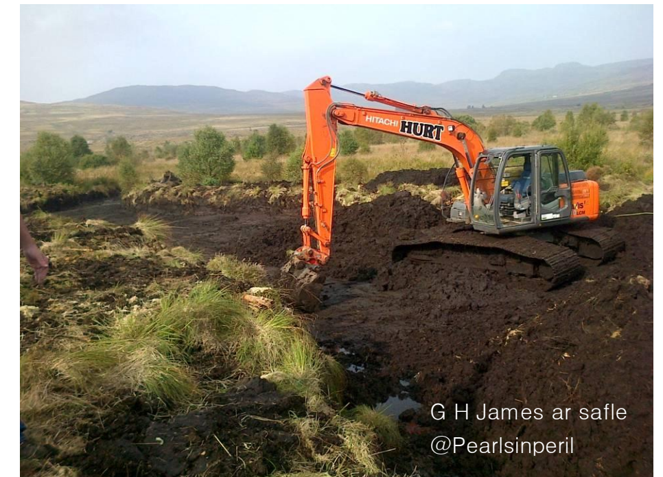
G H James ar safle @Pearlsinperil

Mae gwaith peirianyddol o greu 11 pwll gwaddodi wedi dechrau yma. Mae'r pyllau wedi eu dylunio'n bwrpasol ar gyfer arafu llif dŵr i lawr hyd at 24 awr. Mae'r pyllau wedi cael eu lleoli yn strategol ar gyfer hidlo'r holl ddŵr sy'n llifo drwy'r safle 88 hectar.