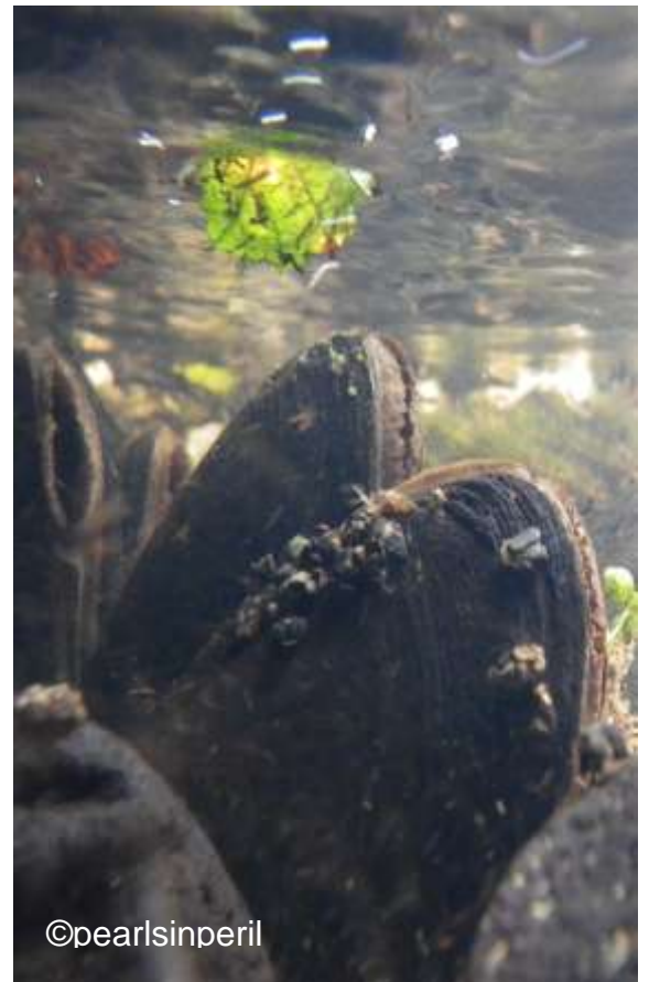
Misglod perl yr afon Eden.

Mae poblogaeth MBDC yr Eden yn un o'r rhai olaf yng Nghymru ac mae angen gweithredu ar gyfer sicrhau dyfodol iddynt.